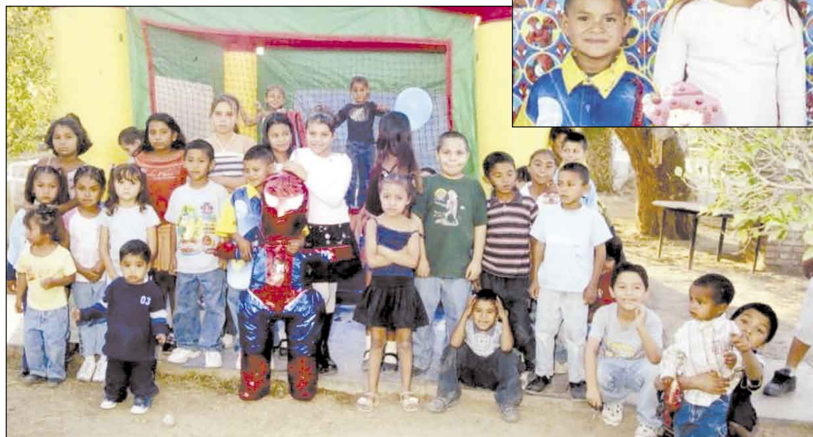
Los pequeñines se divertieron en grande en el "brinca-brinca".

Tras romper la piñata, los asistentes saborearon dos deliciosos pasteles con gelatina de fresa y posteriormente hicieron de las suyas en el "brinca-brinca".