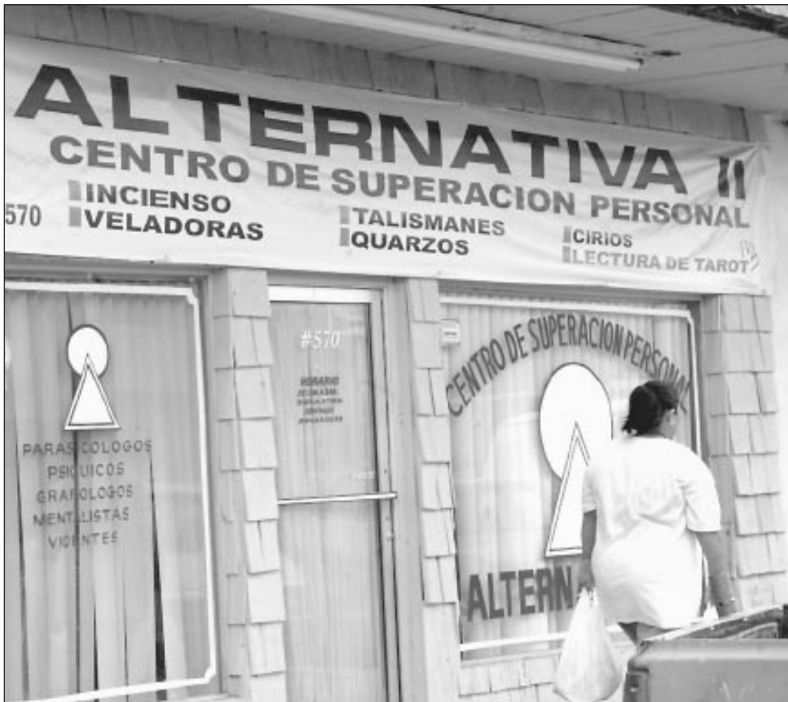
Los consultorios de los síquicos están en la mira.

Es muy común que los esotéricos codifiquen con facilidad los datos que les proporcionan sus clientes, desde la colonia donde viven, para ver su situación económica, hasta que los problemas conyugales, donde entra la cuestión subjetiva de que hay otras