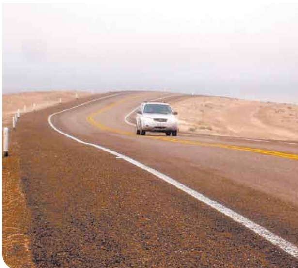
La carretera costera se construyó con el fin de detonar el desarrollo turístico de la región.

La ruta de 134 kilómetros une los destinos turísticos Puerto Peñasco y Golfo de Santa Clara.