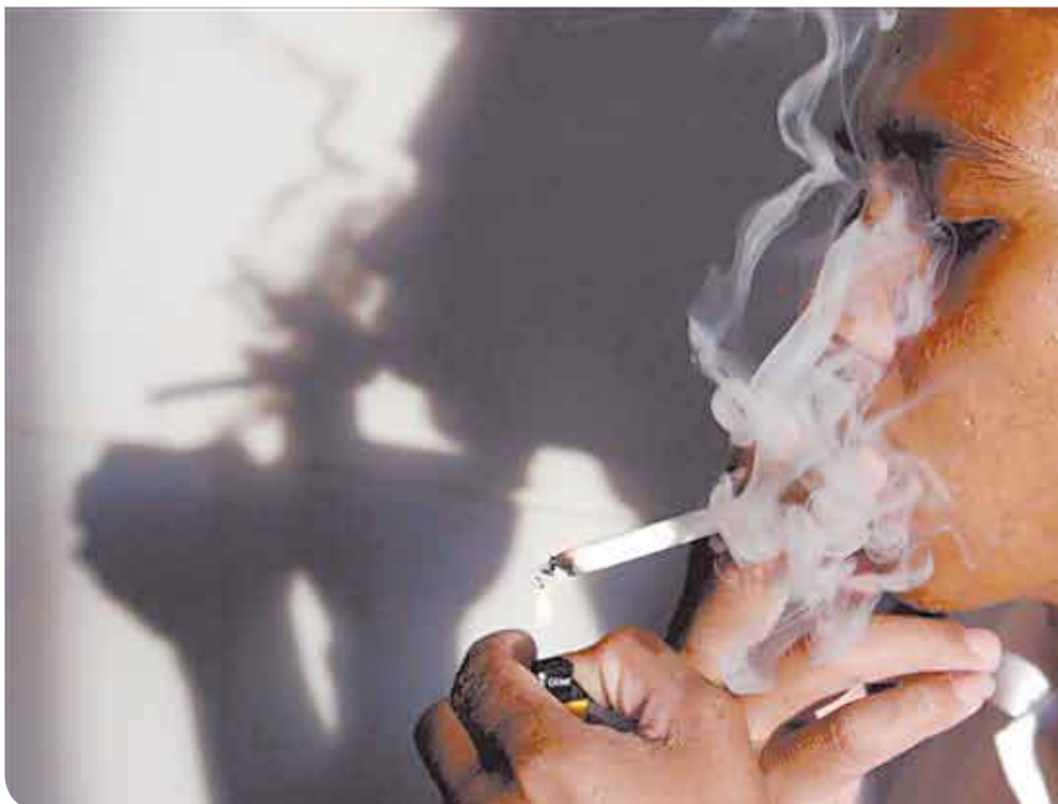
Son tantas las enfermedades que puede provocar el consumo de cigarro, que es importante fijar espacios donde esté prohibido su uso, consideran especialistas médicos.

La Secretaría de Salud, a través del Centro de Atención a las Adicciones Nueva Vida, emprendió acciones encaminadas a prevenir enfermedades relacionadas con el consumo de cigarrillos.